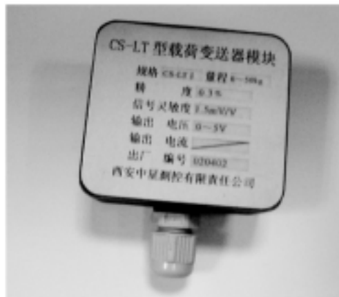
CS-LC1 系列载荷变送器图示一